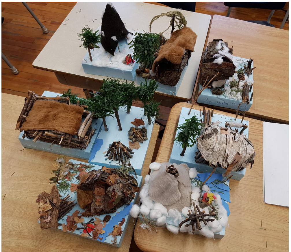
Les élèves de 2e - 3e année ont réalisé de bien jolies maquettes sur le thème des Amérindiens. La créativité de ces derniers est bien impressionnante. Bravo aux élèves de la classe de Nathalie Couture.