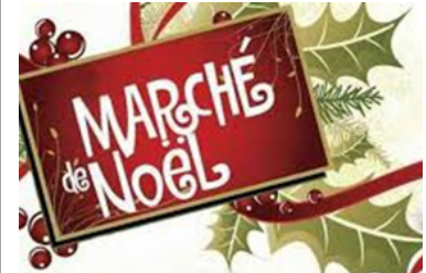
Marché de Noël au Centre communautaire P. 8

Prochaine date de tombée : 30 novembre 2019