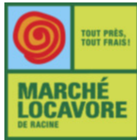
Marché Locavore P. 7