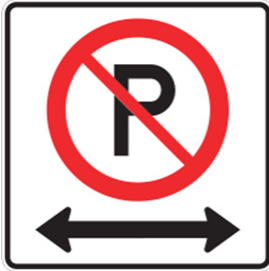
Stationnement dans les rues en hiver P. 3